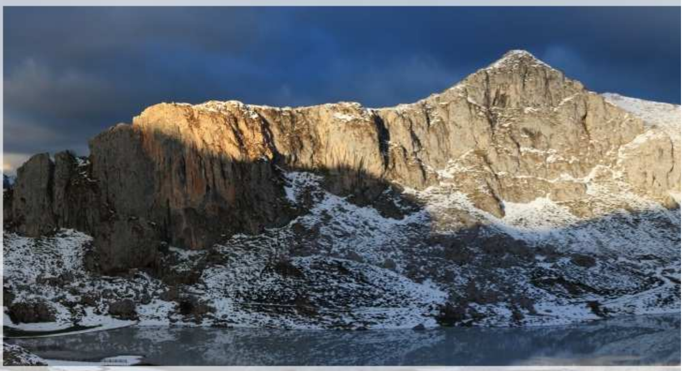
El Enol y El Ercina: