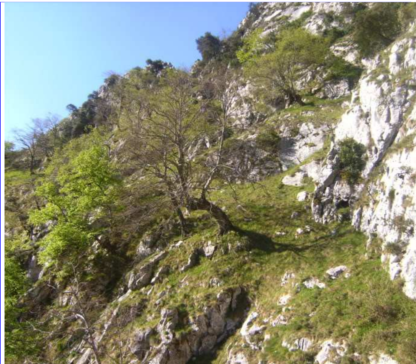
Cueva arriba dando vista a Engüergo