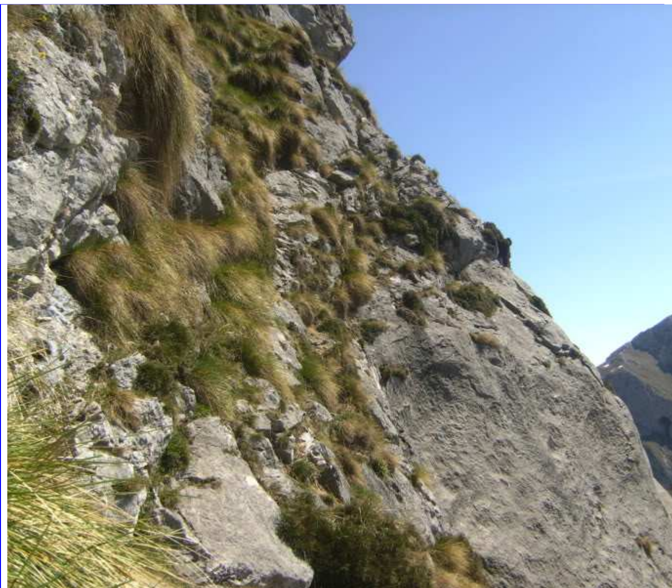
Otra vista de las traviesas