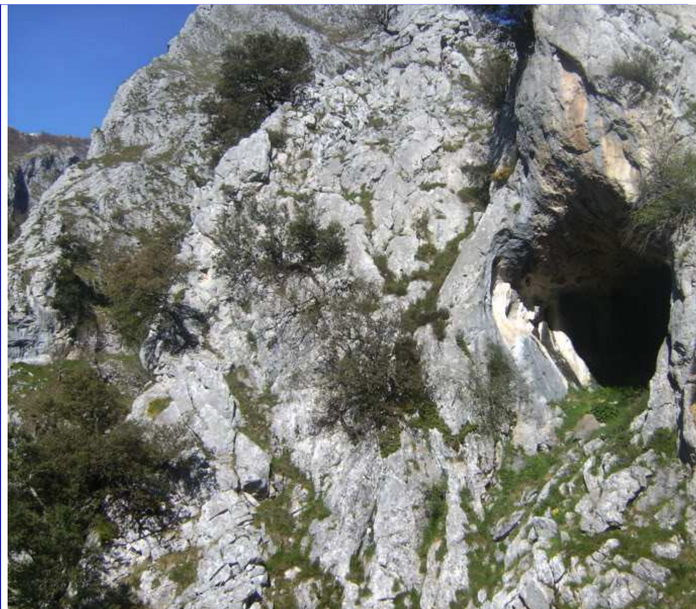
El Ceyoso desde arriba