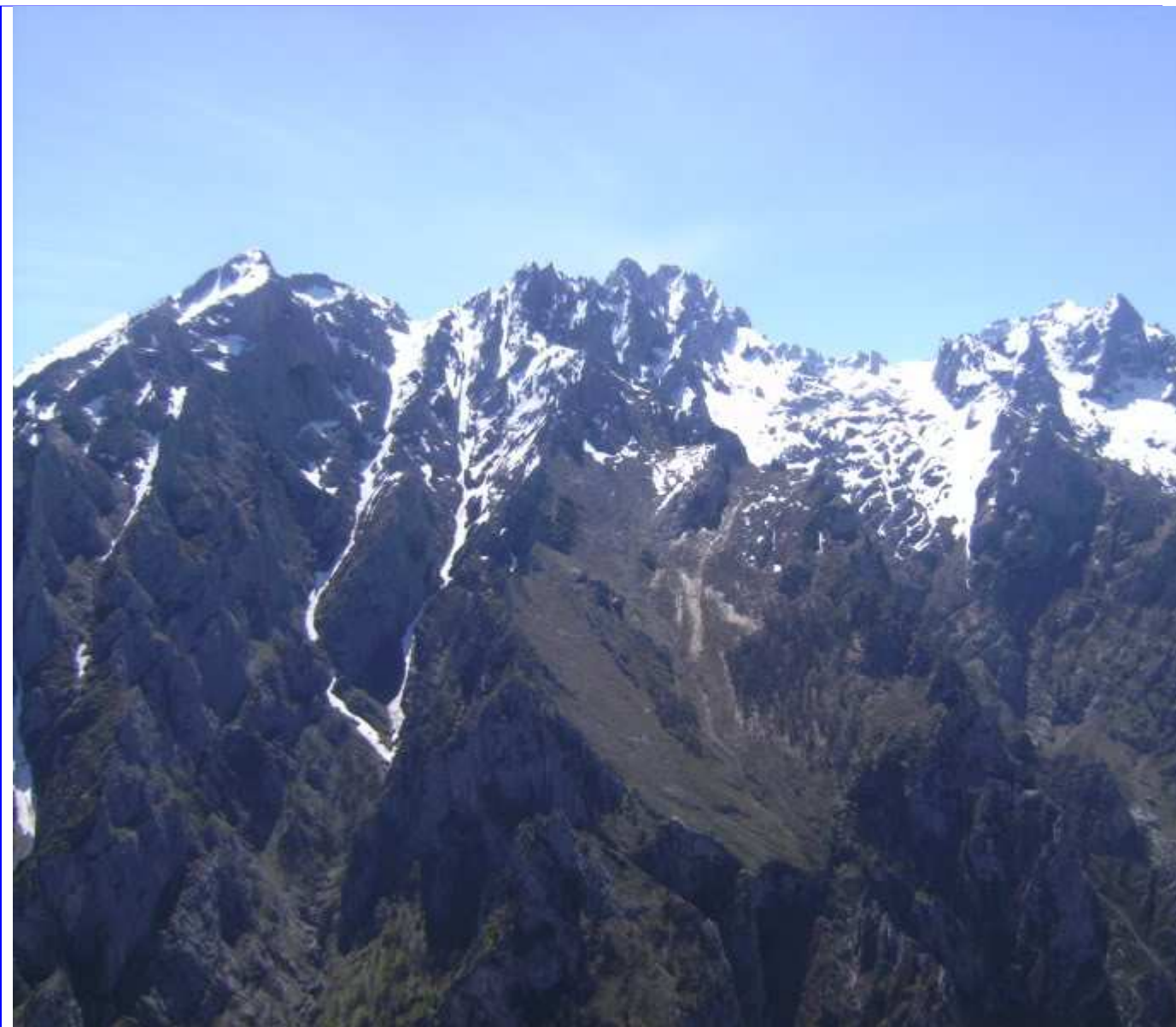
Las traviesas de Lechadoiro