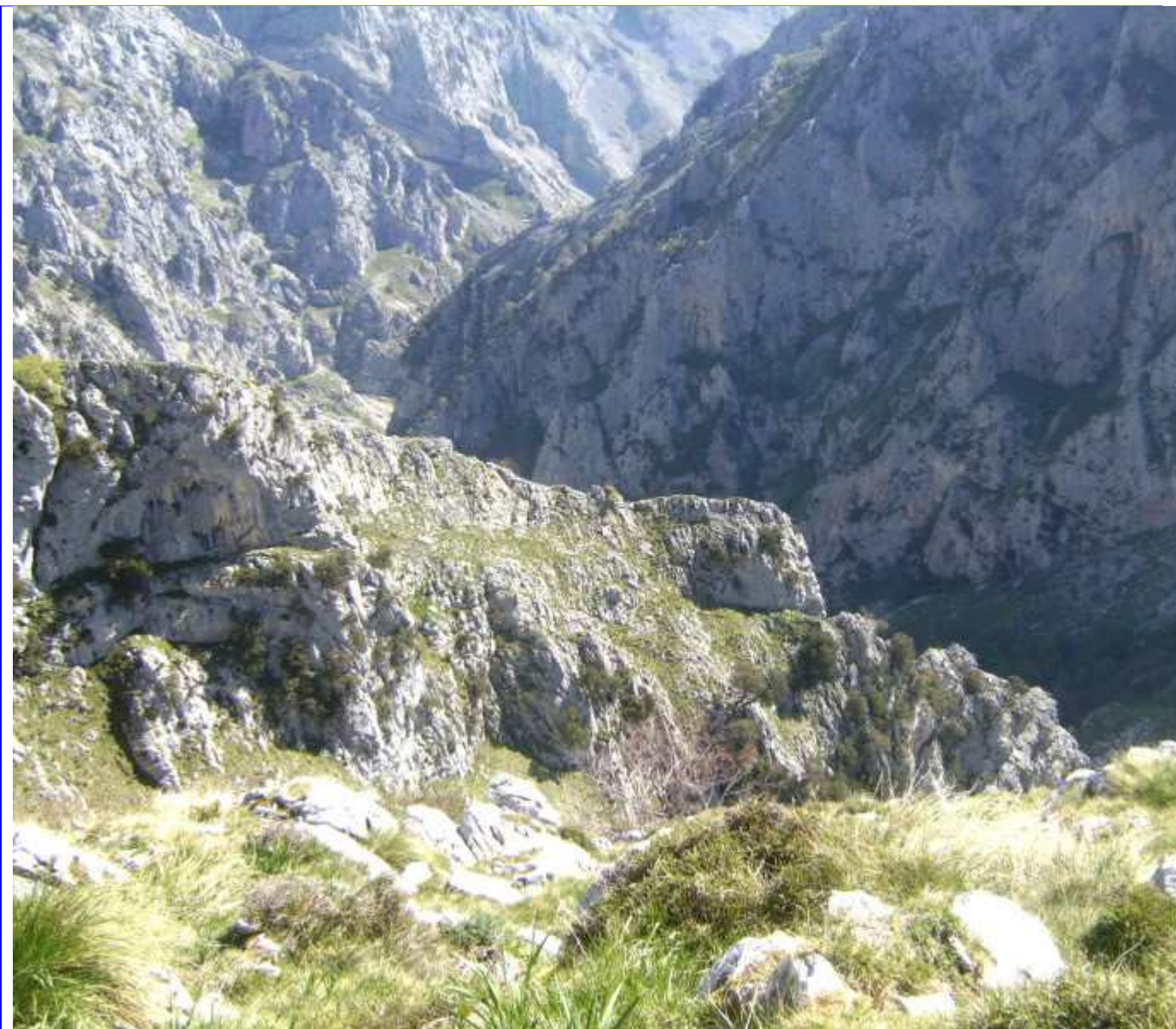
Hacia la canal del agua